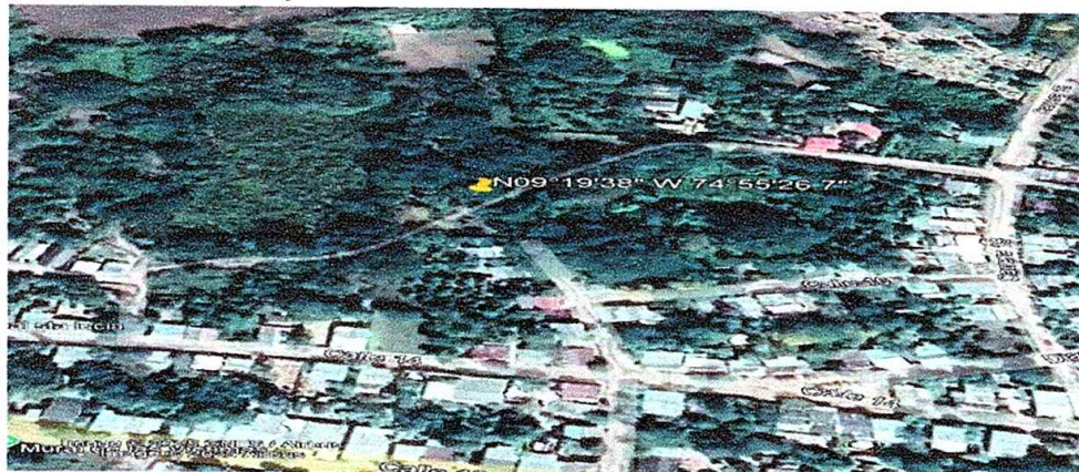
Figura 12. Imagen Google Earth año 2024.