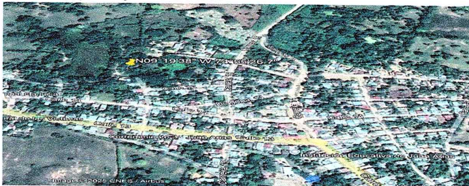
Figura 11. Imagen Google Earth año 2018.