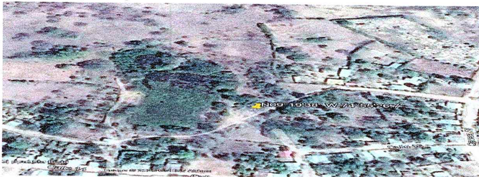
Figura 10. Imagen Google Earth año 2016.