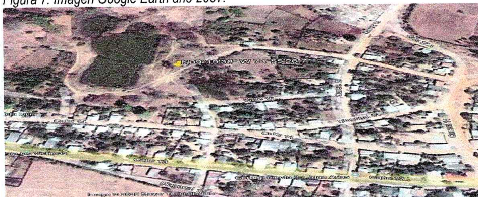
Figura 7. Imagen Google Earth año 2007.