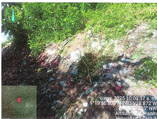
Figura 2, 3, 4. Disposición inadecuada de residuos en la ciénagueta.

Se recomienda la realización inmediata de una reunión interinstitucional con la participación de la Junta de Acción Comunal, la Policía de protección ambiental, la procuraduría agraria y ambiental, la Secretaría de Gobierno y la empresa de aseo, para definir un plan de acción estructurado, establecer responsabilidades específicas y crear un mecanismo de seguimiento y evaluación que permita verificar la disminución efectiva de los impactos ambientales identificados.