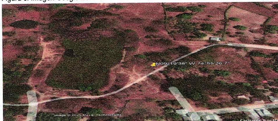
Figura 8. Imagen Google Earth año 2010.